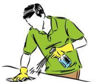
Tisch sauber machen

- Büroräume (inklusive Sekretariat) sind für nichtfestangestellte LBW-Mitarbeiter nur mit Mund-Nasen-Schutz zu betreten, auch hier ist der Mindestabstand einzuhalten.